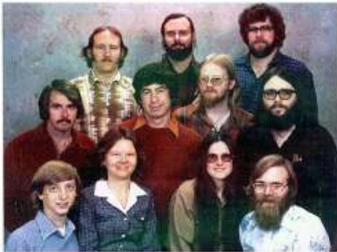
Microsoft Corporation, 1978